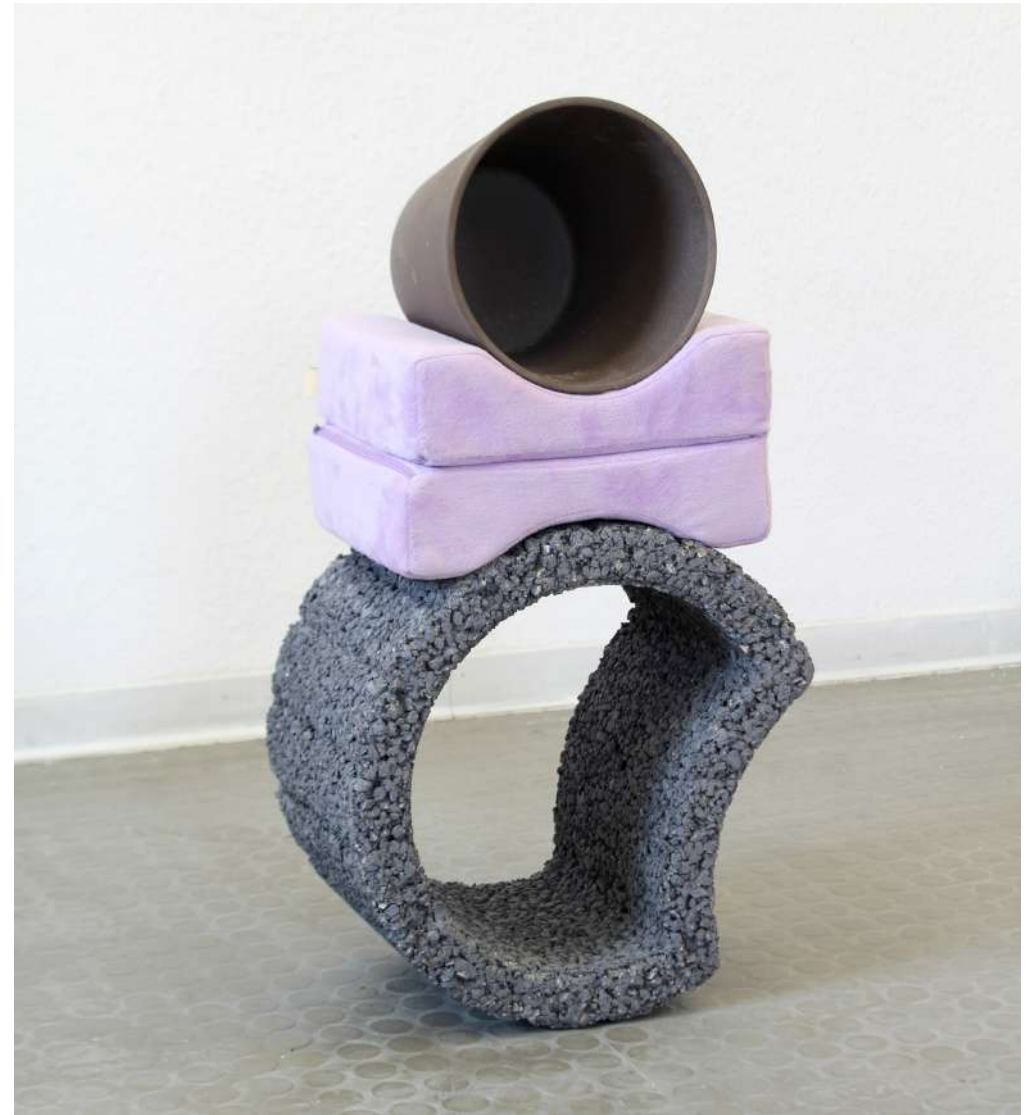
Baptiste Croze, Les Formes Données , 2018 © Baptiste Croze