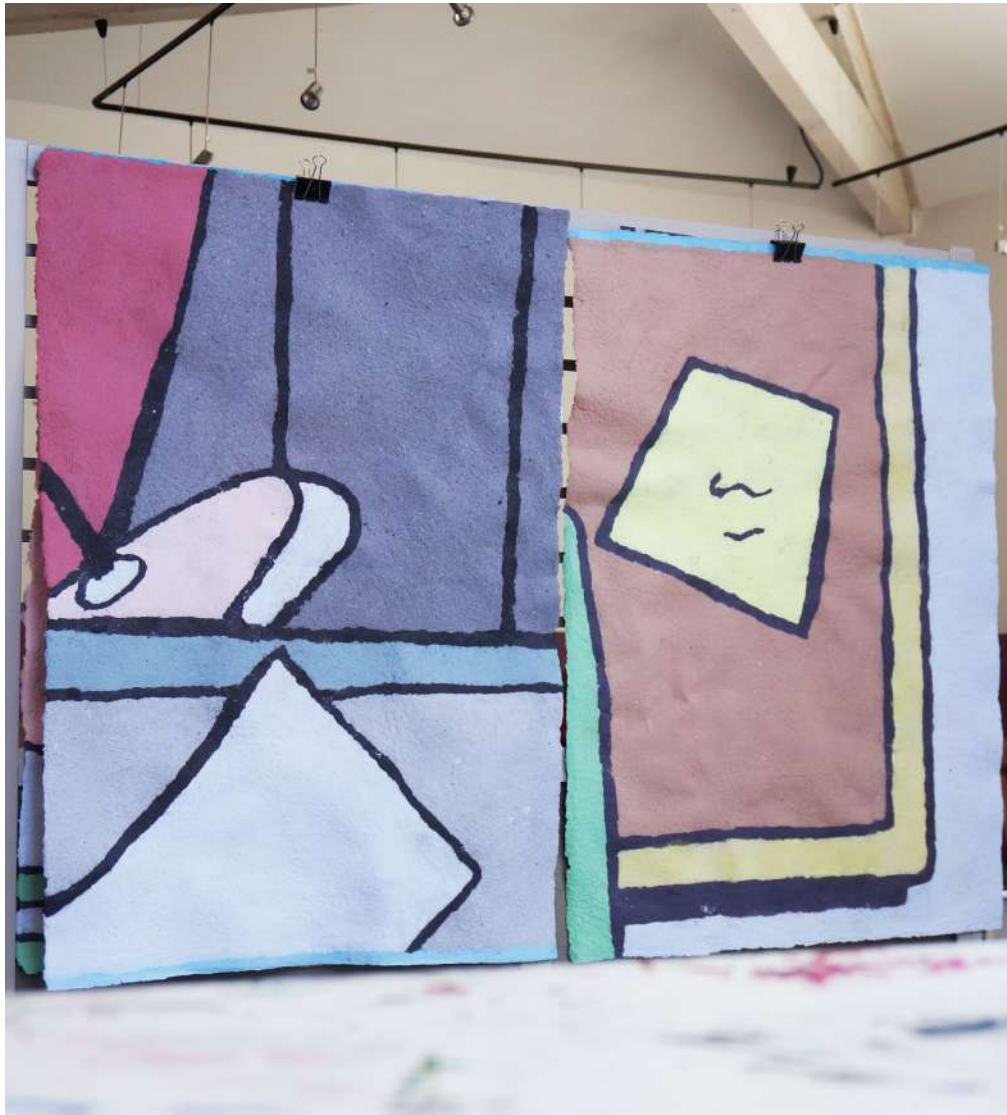
Victoire Barbot, œuvres en papier en cours de séchage, 2021