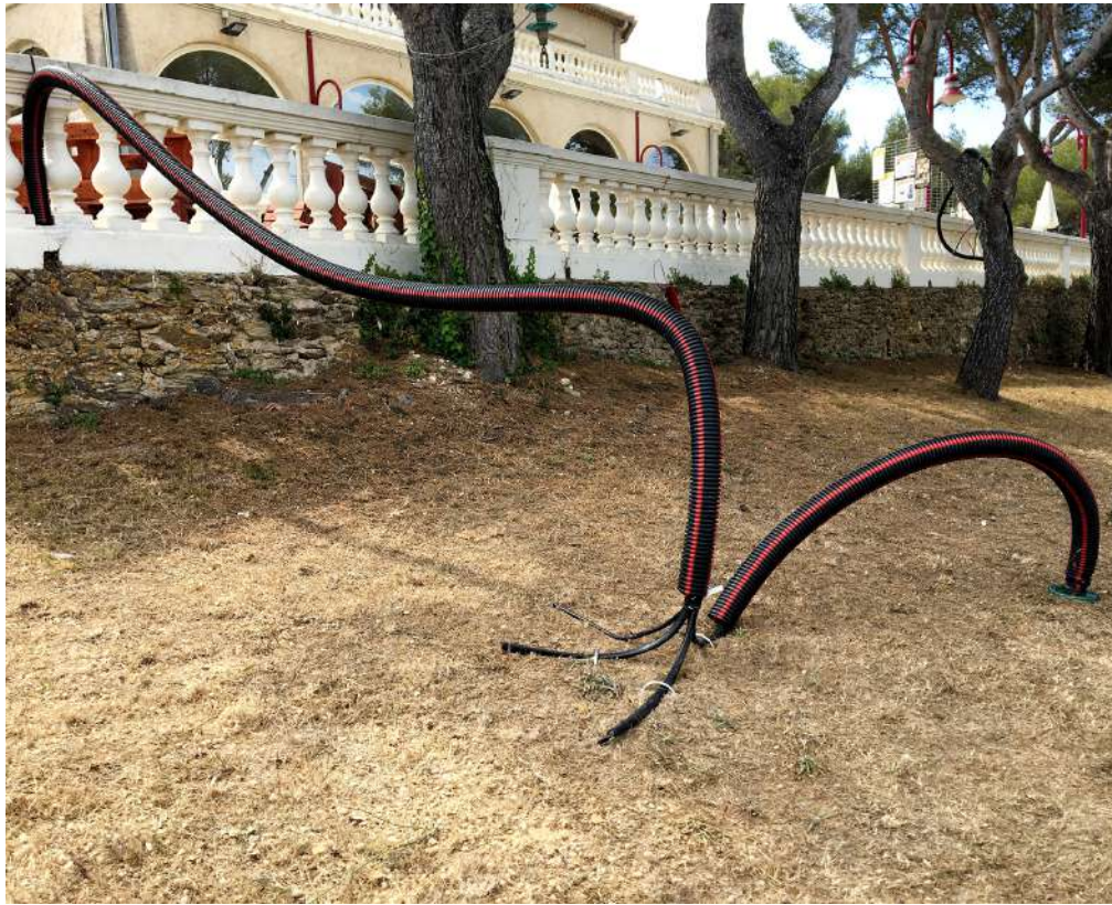
Karine Debouzie, Derivation en série , 2021, Objets divers, Dimensions variables © Karine Debouzie