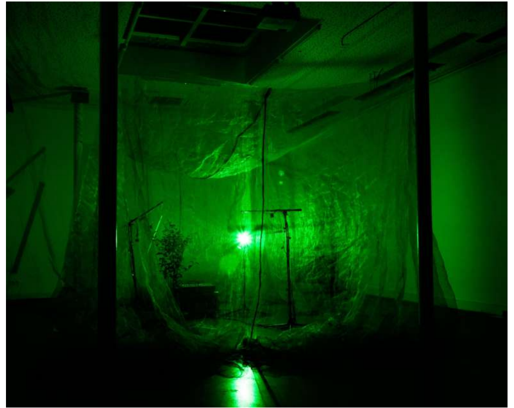
Thomas Laigle, Vue de l'espace volière , 2020