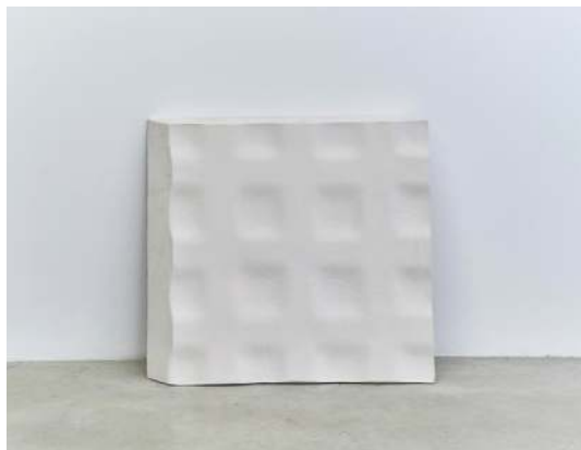
Sans titre, 2016 Résine acrylique 60 x 60 x 1 cm

Comment mouler un phénomène ? Comment mouler une surface ? Chacun des objets de Rachel Poignant tente de répondre à cette question, de poser l'opération, de la reprendre encore. Depuis 1998, elle recycle le même bloc de paraffine pour en mouler les formes, les accidents et les dénivelés. Cette matière est l'élément premier d'un processus de fabrication, où la sculpture devient une suite d'enregistrements des légères variations de surfaces. C'est dans ce presque rien que se nichent les nuances et les rythmes, les alternances de creux et de reliefs qui font le motif. Ajoutée à cette suite d'objets, Rachel Poignant expose une tentative, celle d'un agrandissement, pour faire et voir en même temps les infimes variations d'une situation.