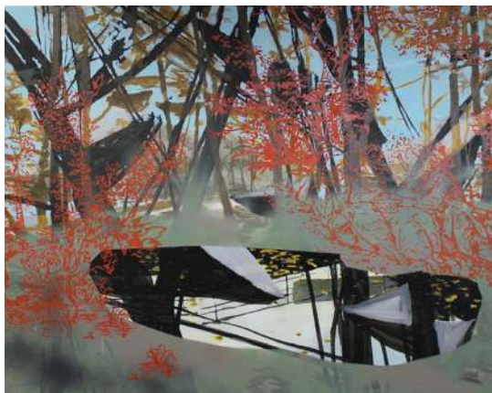
Sans titre (reflet) , 2016 Huile sur toile, 110 x 89 cm

Vit et travaille à Marseille nicolaspincemin@wanadoo.fr