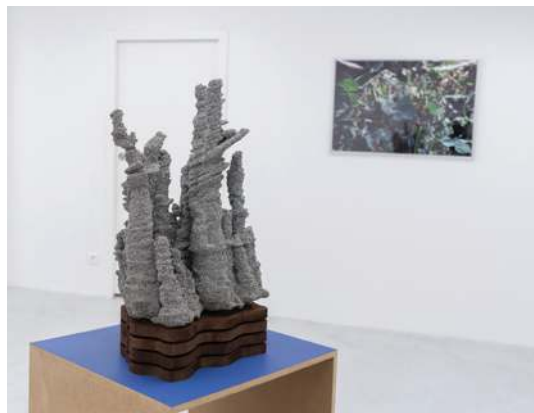
Algorama , 2018-2019 Sculptures aléatoires, litière pour chat, résine, socle en hêtre, peinture 140 x 63 x 63 cm