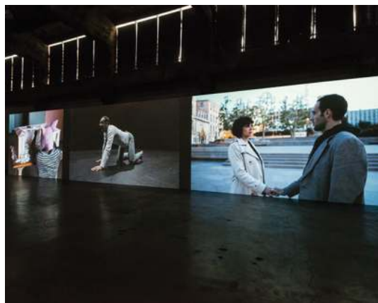
Hôtel formes sauvages , 2009-2015