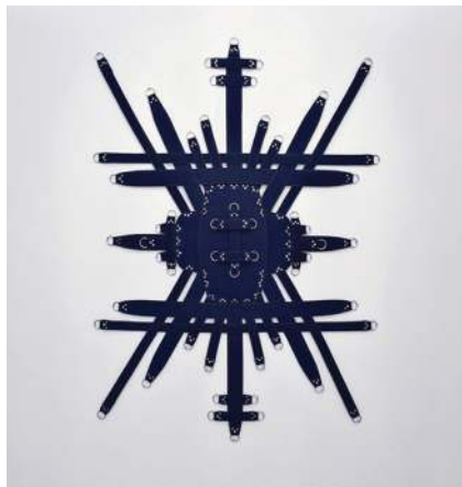
Thaumaturgia Discipline I.I. , 2019 Orthese médicale, rivets, anneaux, fils, extrait de lavande Dimensions variables, 250 x 150 cm chaque bas-relief Partenaire : Médical Distribution France

Dans l'œuvre de Floryan Varennes, il y a un syncrétisme, une rencontre improbable entre l'histoire médiévale, dont il se nourrit sans cesse, et la sociologie de la mode et du genre qui l'habite. Au croisement de ces champs, il produit une œuvre esthétique qui rejoue, redéfinit, transforme ou combine des codes. Ainsi quand ses sculptures convoquent les étendards médiévaux, ils sont réalisés en cuir holographique ( Codex Novem , 2018). Avec enthousiasme, l'artiste embrasse d'un même regard les Frères de Limbourg et Judith Butler. Les cols de chemises ou de vestes deviennent des motifs, ils figurent une idée du pouvoir et de la contrainte des corps. Le vêtement est le véhicule d'une identité publique qui affirme autant qu'il peut taire. Dans l'œuvre de Floryan Varennes, il est morcelé, démembré, revendiquant dès lors une identité hybride.