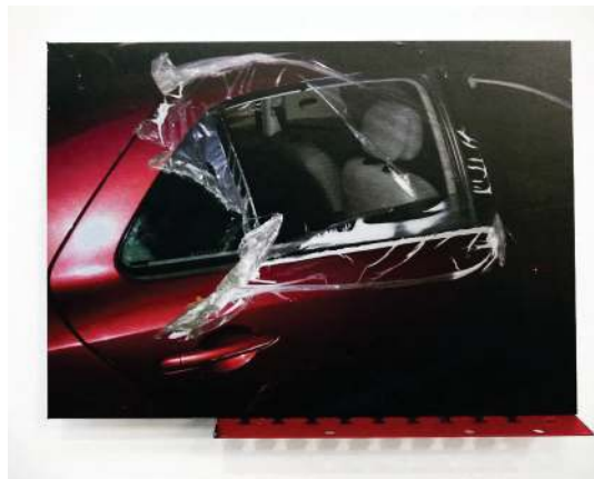
Crash , 2019 Photographie

Juliette Feck commence à l'Accademia di Belle Arte di Palermo, elle y développe un goût prononcé pour la photographie et nourrit un univers très personnel, quasi obsessionnel, compilant des images de perte, de casse et de fracas, souvent violentes et étroitement liées à la mort. De retour en France elle intègre l'ESADHaR et continue ses recherches mêlant sculptures et photographies avant d'obtenir son DNSEP avec les félicitations du jury en 2012. Premier prix de la résidence de la Villa Calderon l'année suivante elle continuera ses recherches sur les changements d'état et la condition des choses dans l'étroite relation qu'ils entretiennent avec l'humain. Son travail embellit les refus de l'homme à accepter certaines réalités de l'existence. Ses vanités se retrouvent en de nouvelles formes, oscillant entre le mystique et le prosaïque, l'éthéré et l'ancré.