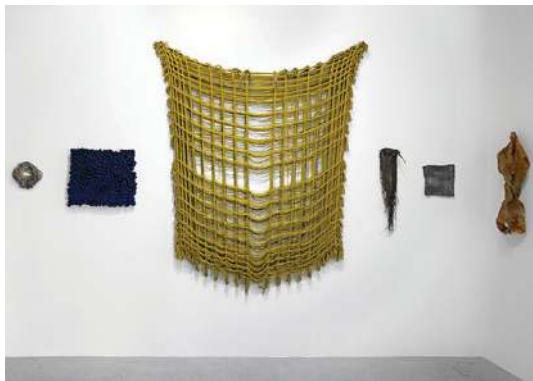
Sans titre, 2016