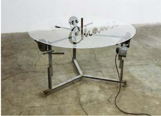
Bonne chance , 2018 Table agricole rotative, plexiglas 180 cm de diamètre

D'un certain point de vue on pourrait dire que les œuvres de Rémi Bragard partagent une savante curiosité pour l'objet scientifique. Sculpturales (le plus souvent), elles organisent des recherches formelles et techniques avec un soucis affirmé pour l'expérience et l'empirique. Cet intérêt pour le phénomène (la caléfaction, la corrosion, la concentration des intensités...) alimente le développement d'une œuvre ouverte ancrée à la réalité. Ce travail se rapporte implacablement au monde, il trouve dans sa rationalisation le moyen de proclamer une présence. Décomposant et reproduisant avec une précision toute bricolée les mécanismes du réel, l'œuvre dit aussi son potentiel à agir sur lui.