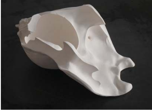
Soixante-quinze (Centurie), 2017 Plâtre armé (empreinte corporelle) 50 x 45 x 25 cm

Arnaud Vasseux travaille la fragilité comme on travaille un médium. Il ne s'agit pas de porter un discours "sur" mais de donner à expérimenter "avec". Avec le risque, avec l'inframince, avec le temps, avec la matière qui fait corps jusqu'à se déliter. Dans son œuvre, le plâtre est non armé, livré à l'équilibre et à la pesanteur, les sculptures s'élancent avec fragilité, parfois s'effondrent et se brisent. La rupture n'est pas recherchée ni dissimulée, mais assumée comme un accident possible parmi d'autres. Ce que tente de saisir l'artiste c'est l'insaisissable, ce point de tension à partir duquel les corps deviennent instables, s'usent, cèdent ou font front. Alors les cassables tremblent, les résines fixent le mouvement, le plastique enserme, les roches s'agglomèrent. Aux formes minimales qui composent le vocabulaire plastique d'Arnaud Vasseux répond la matière minimum qui vient les structurer, ainsi s'élabore une œuvre aux contours tracés d'essentiel.