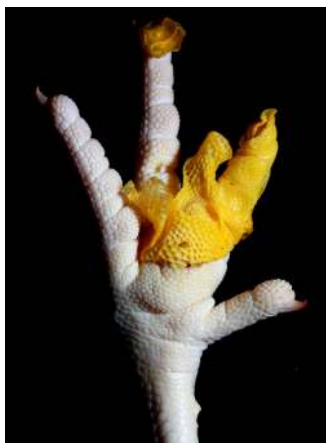
La Derivada mexicana / La Dérivée mexicaine , 2009 Tirages Lambda sur aluminium, 120 x 80 cm chaque