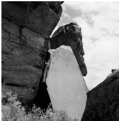
Hypothèse du Regard, variations discontinues et greffes instables