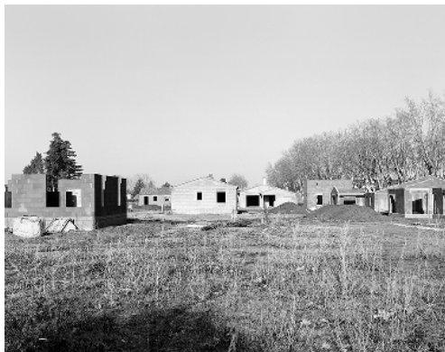
Sous le vent / terrain à bâtir, 2018

Vit et travaille à Marseille Membre de l'agence Signatures, Paris pascalgrimaud@free.fr