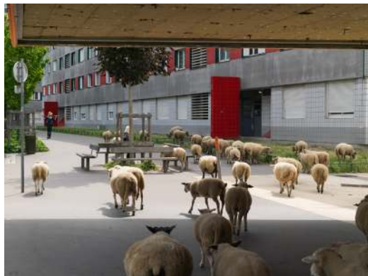
Le Principe de ruralité

Photographies d'objets, de gestes et de paysages agricoles dans la métropole parisienne