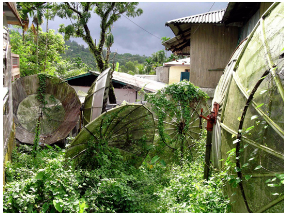
De Port Blair à Port Blair, 2004-2006