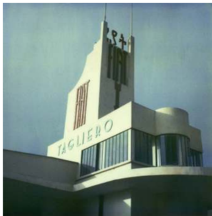
Asmara Dream , 2006-2008 80 photographies couleur Polaroid originaux + tirages pigmentaires 20 x 20,5 (éd de 10) et 80 x 82,5 cm (éd de 5)