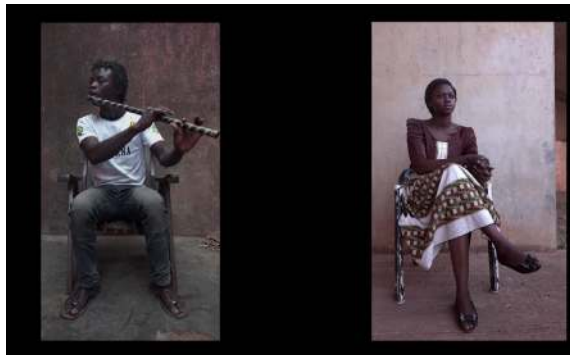
La dernière trompette , 2018

Installation vidéo, vidéo HD couleur, diffusion multi-écrans (dimensions variables) Burkina Faso-France, projet lauréat Mécènes du Sud, avec le soutien de la Région PACA et de la FNAGP.