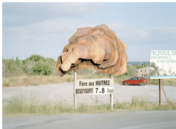
Oyster , Bouzigues, 2009

Dans le cadre du projet Atlas - Post huître