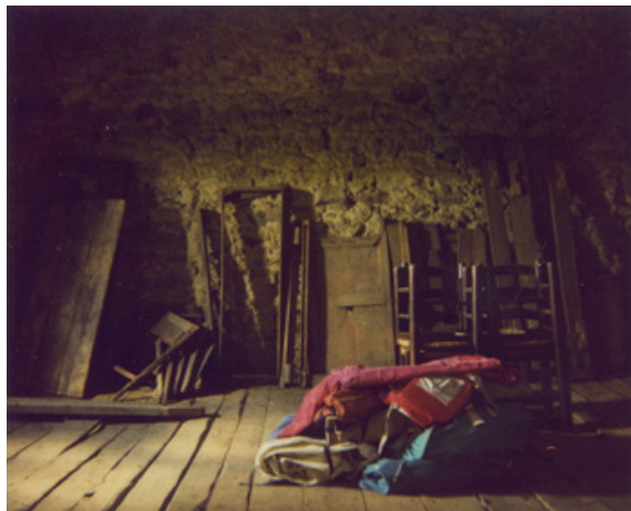
Vues Héritages, Maison de la Ville es Bret, 1994-2005 28 émulsions polaroid, format image 22 ensembles de 6 émulsions polaroid, format image, montées dans 22 cadres d'archive

né en 1968 à Dinan vit et travaille à Saint Méloir des Bois (35) villesbret@gmail.com