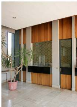
Grand ensemble, 2009 Diptyque, photographie couleur, tirages argentiques 95 x 68 cm

né en 1960 vit et travaille à Rennes hervebeurel@wanadoo.fr