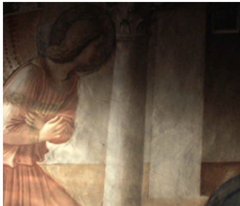
Le 25 mars , 2015