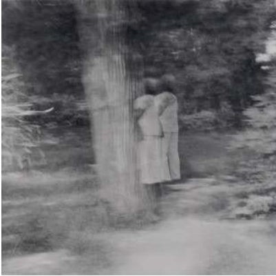
Xian, Chine, 2010 Tirage argentique

Née en 1959 à Ranchi, Inde Vit et travaille à Marseille ariadnebreton@gmail.com ariadnebretonhourcq.com