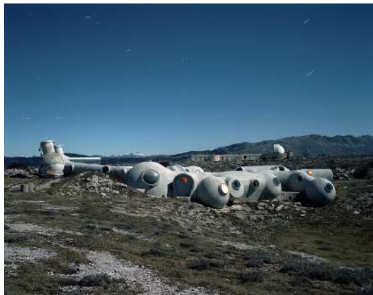
Les arpenteurs , 2014 Impressions pigmentaires sur papier Photo Rag 308g 40 x 50 cm