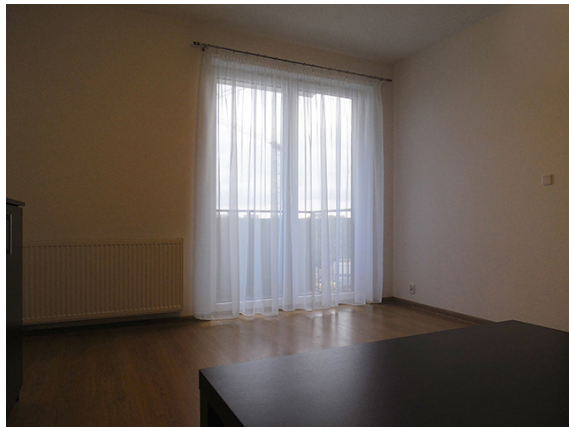
Clickworkers, 2017 Vidéo, couleur et son 8 min 23

Martin Le Chevallier développe depuis la fin des années 90 un travail politique fait de films, de détournements ou d'interventions contextuelles. Il s'est fait auditer par un cabinet de consulting, s'est rendu en procession à Bruxelles pour y présenter un drapeau européen miraculé, a sécurisé un bassin des Tuileries à l'aide de petits bateaux de police télécommandés ou a disposé dans une vitrine des gradins tournés vers la rue afin de suggérer que la ville est un théâtre ou que le monde est une fiction. Dans ses films ou installations vidéos, il propose des représentations du Monde alliant la précision du documentaire à la fantaisie de la fable.