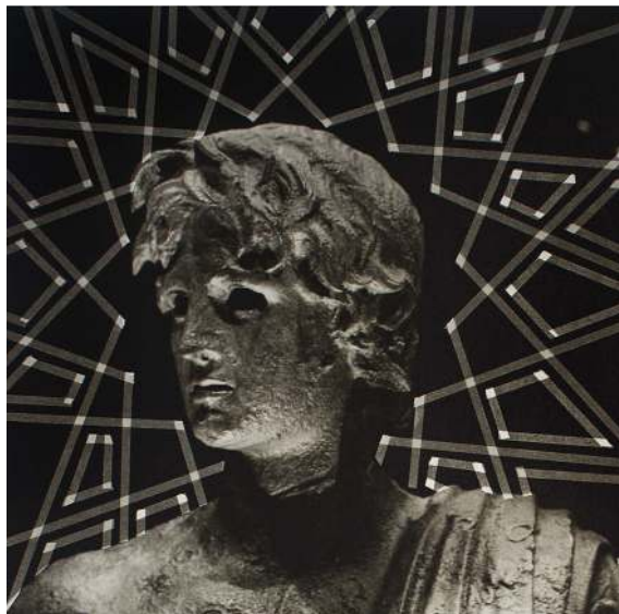
Sans titre, 2017 épreuve argentique noir et blanc sur papier baryté collé sur dibond 45 x 51 cm Production Musée de l'Éphèbe d'Agde