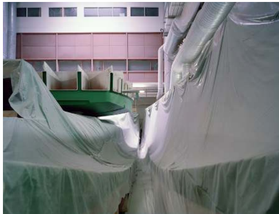
Keroman / Mécanique Générale, Lorient, 2017