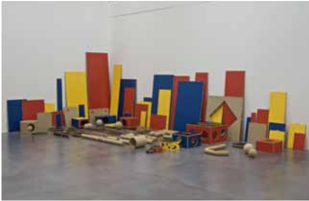
Vue de l'exposition Il faut maintenant construire le monde , 2015 FRAC Poitou-Charentes, Angoulême

« Force est de constater que mes sculptures apparaissent dans des contextes précis. Les contraintes de production et de monstration sont les premières lignes de mes cahiers des charges. Ainsi le contexte d'exposition est un élément central du processus de travail. Je commence généralement celui-ci en m'attachant au contexte architectural ou spatial, qui m'amène ensuite à aborder les contextes socio-historiques.