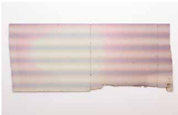
Sans titre, 2014-2016 Posters, impressions UV sur bois, 104 x 50 cm