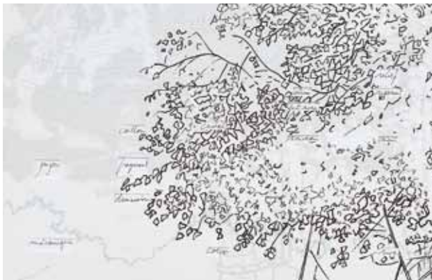
Jeune homme (détail), 2015 - 2016

Panneau de contreplaqué 10 mm, papier, feutre, crayon, papier de soie coloré, stylo