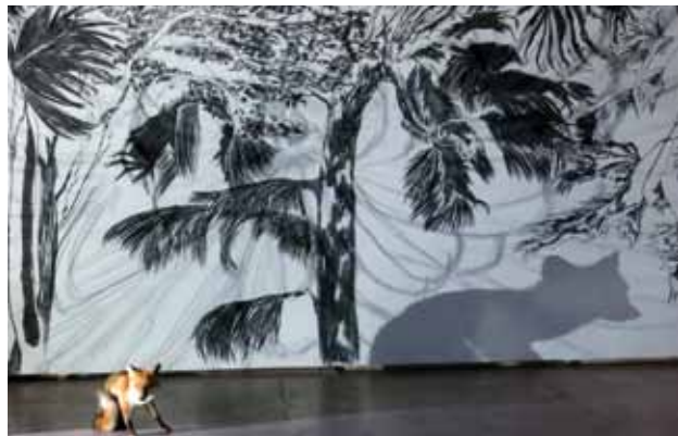
Lorsque l'été lorsque la nuit (Jean Tardieu), 2014

Dessins au fusain, 3 dessins animés projetés, taxidermies (renards), dimensions variables Vue de l'exposition Lorsque l'été lorsque la nuit , CAIRN Centre d'art, Digne-les-Bains