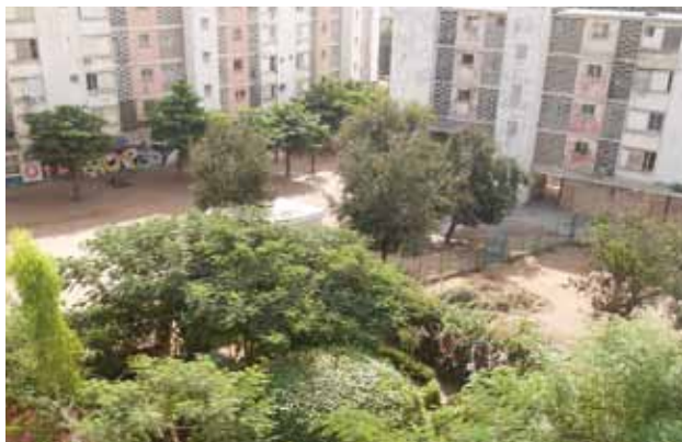
Jardin Jet d'eau, sculpture vivante, Dakar, 2014 - 2017