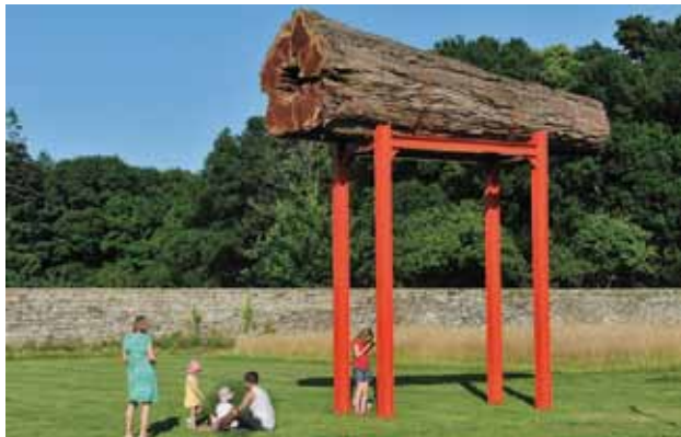
Le grand séquoia , 2013 Séquoia, acier peint, 6,30 x 5,20 x 1,90 m - Manoir de Kernault, Finistère

Représenté par la Galerie Claire Gastaud, Clermont-Ferrand rolandcognet@orange.fr