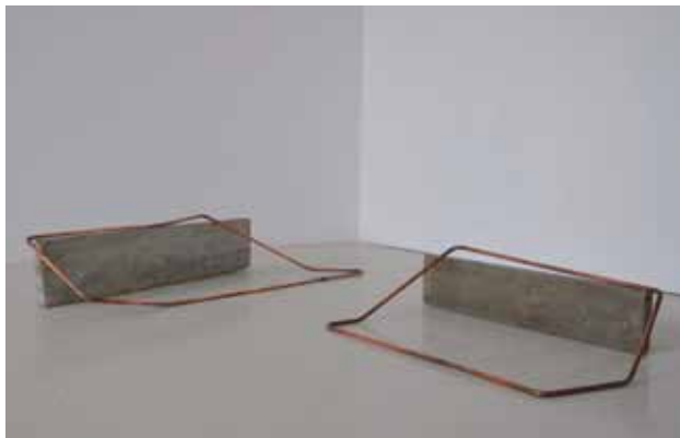
Sans titre ( forme ), 2014 Béton, tuyaux de cuivre, 150 x 55 x 23 cm / 102 x 65 x 23 cm

Vit et travaille à Clermont-Ferrand Représenté par la Galerie Quatre, Arles et la Galerie Louis Gendre, Chamalières hbrehier@yahoo.fr