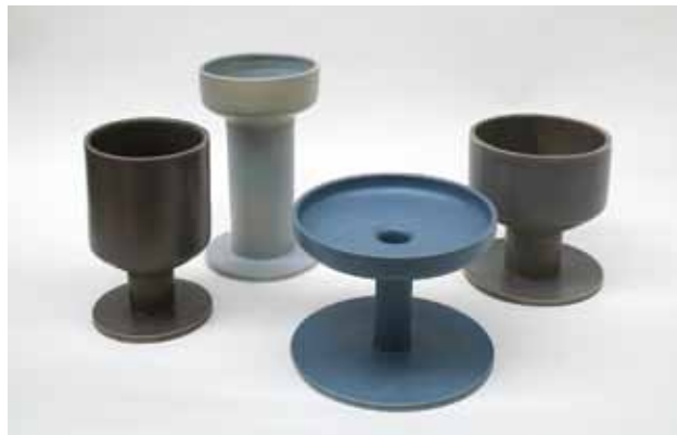
À pied, 2013 Différents vases en faïence

Tous deux diplômés de l'école des Beaux-Arts de Saint-Étienne, Grégory Blain et Hervé Dixneuf fondent l'Atelier BL119 en 2007.