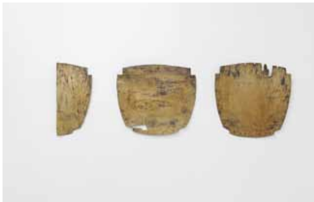
Les Commères , 2017

Assises en placage bois, résine époxy, dimensions variables