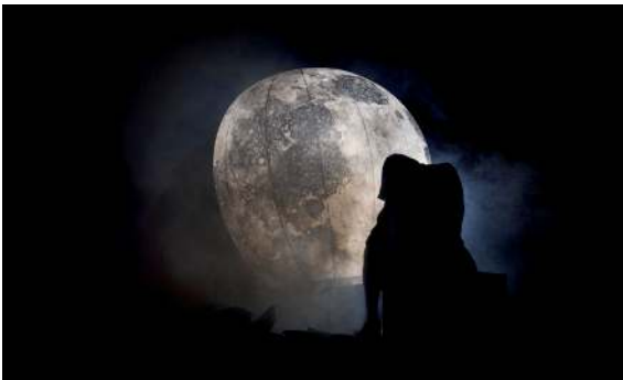
Frightenight (travail en cours) Spectacle, 50 minutes