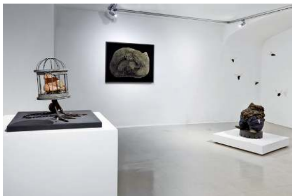
Hannibal Noser, 2015

Cage d'oiseau, pattes de volatile, époxy, huile, 20 x 15 x 25 cm