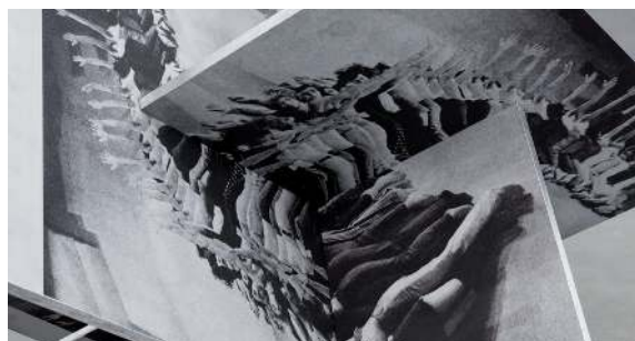
Liquid Theater, 2013

Aluminium sérigraphié, 140 x 140 x 140 cm