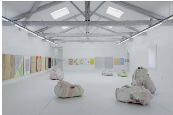
Il faut reconstruire l'Hacienda, 2016

Vue de l'exposition au Musée régional d'art contemporain, Sérignan