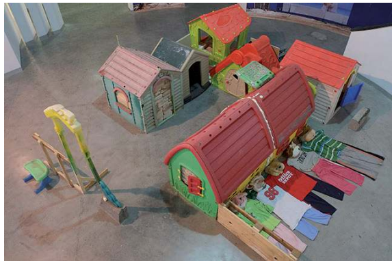
Minimalia (mini-mal-ya) , 2015

Vue de l'exposition ArtParkCraftRaftClinicClubPub , Museums of Bat Yam, Tel Aviv, 2015