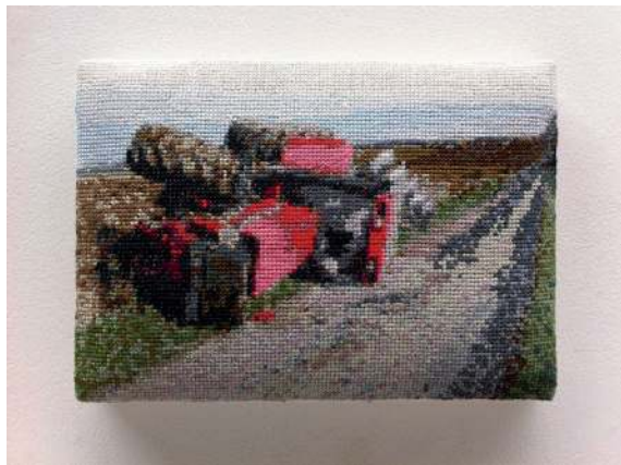
Ici les paysans avancent, 2011-13

Né en 1966 vit et travaille à Brest rivetpascal@orange.fr www.pascalrivet.fr