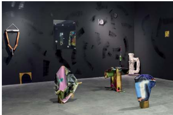
Helter Skelter (Une copie sans modèle) , 2016

Vue de l'exposition au Frac des Pays de la Loire, Carquefou