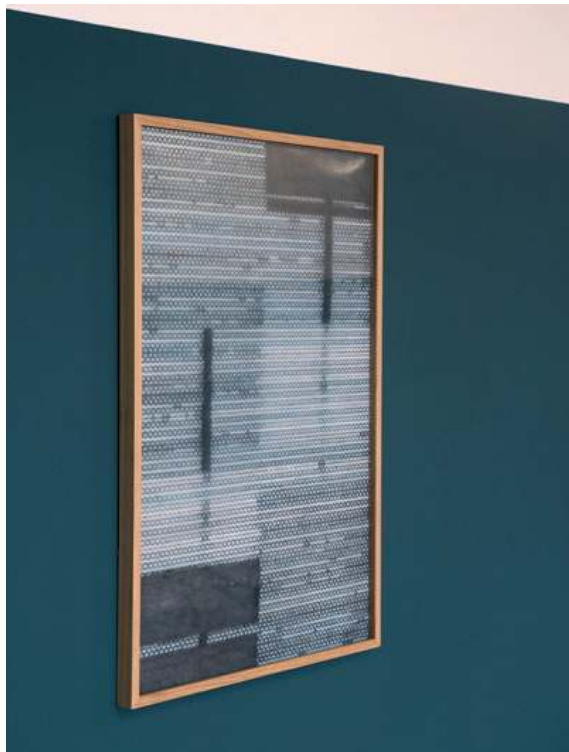
Vue de l'exposition Ligne de flottaison, Galerie du 5ème, Marseille, 2015