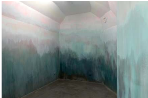
Caverne Liquide , 2015