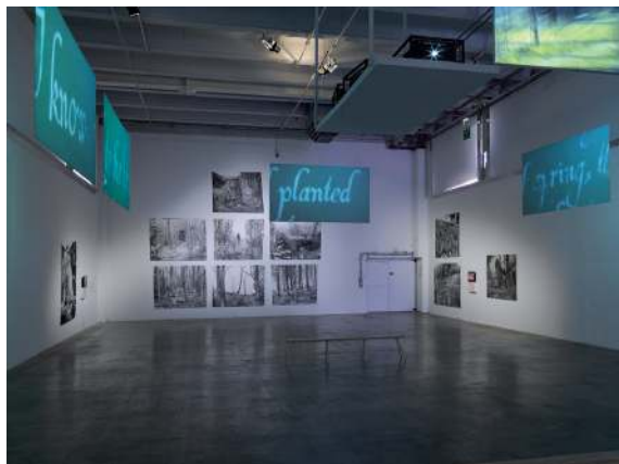
Nothing at all - Modes idiorythmiques de la coexistence , 2016 Exposition de David Ryan et Jérôme Joy au Palais de Tokyo, Paris

vit et travaille à Plougastel-Daoulas letouzeryan60@gmail.com