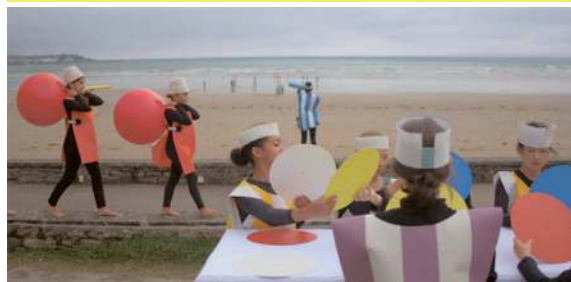
Le rêve géométrique , 2017 Affiche du film Court métrage 4K couleur sonore, durée 13mn31

Oscillant du familier au mystérieux, de l'image-mouvement à l'arrêt sur image, la pratique artistique de Virginie Barré se décline en dessins de chefs indiens solennels, installations d'étranges mannequins accessoirisés et évocations acidulées de l'enfance. Ses œuvres, qui procèdent d'une pensée du collage et de l'assemblage, constituent les bribes d'un roman-feuilleton ou d'un drôle de polar. Hantées par des souvenirs cinématographiques, elles apparaissent comme autant d'énigmes pour le spectateur.