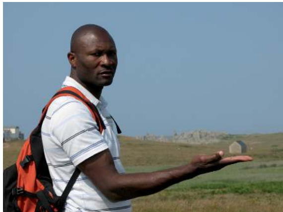
Maison mobile, 2009 Photographie