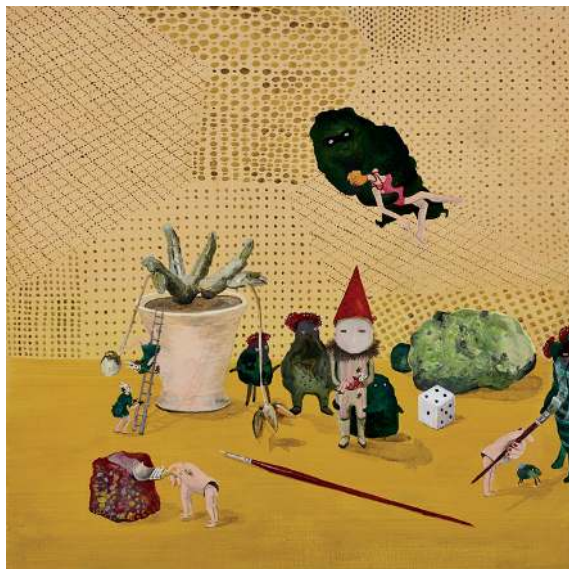
Détails , 2016 Huile sur bois, 30 x 30 cm