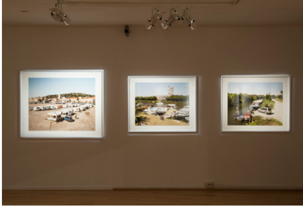
Vue de l'exposition Rhodanie, paysages déclassés , Musée de l'Arles Antique, Arles, 2014

Né en 1978 Vit et travaille à Lyon b.stofleth@free.fr