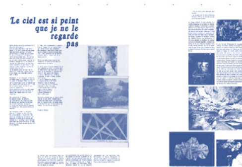
Le journal bleu , 2014 Edition Galerie Françoise Besson Catalogue de l'exposition Le ciel est si bleu que je ne le regarde pas

Né en 1964 à Toulouse Vit et travaille à Lyon Représenté par la galerie Michel Descours, Lyon frederic.khodja@gmail.com