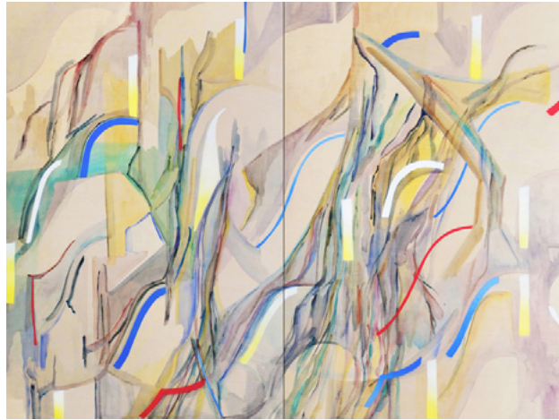
Le fleuve , 2019 Acrylique sur bois, diptyque, 120 x 160 cm

Née en 1983 à Clermont-Ferrand Vit et travaille à Oullins Représentée par la galerie Françoise Besson, Lyon liseroussel@gmail.com