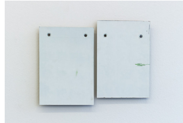
Flottement (vert de gris), 2018 Huile sur bois perforé, feutre, crayon, clous, 29,7 x 21 cm chacun

Né en 1979 Vit et travaille à Lyon guillaume_perez@icloud.com