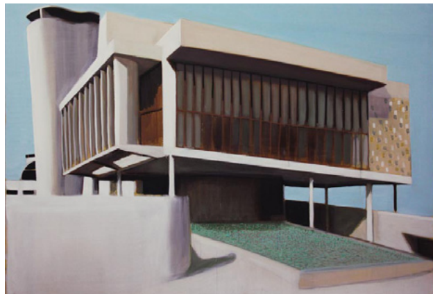
Paysage 126, 2014 Huile sur toile sous plexiglas, 186 x 211 cm

Né en 1980 à Marseille Vit et travaille à Lyon Représenté par la galerie Isabelle Gounod, Paris contact@lironjeremy.com