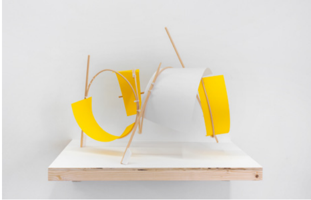
Esquisse aux vents N°8, 2020 Fil de rotin, bague de bois, carton plume, papier, attache colson, 34 x 45 x 30 cm

Né en 1983 à Ruian, Chine Vit et travaille à Lyon mengzou@gmail.com