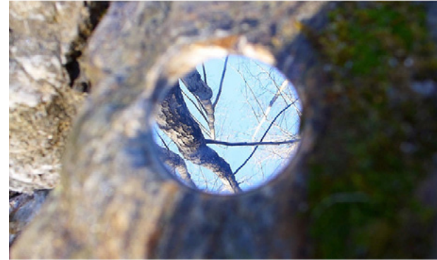
Les yeux de la Sueille, 2020

Représenté par la Galerie Laurence Bernard, Genève koppjan@gmail.com