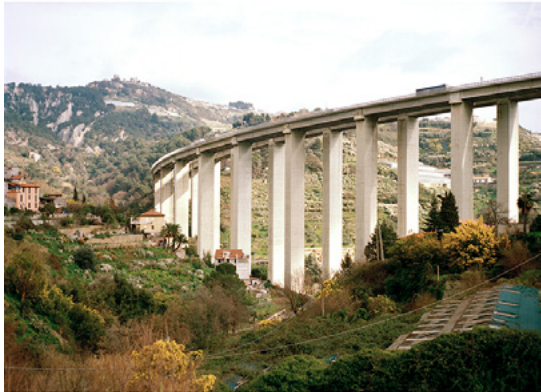
Les princes de la ville , 2016-2018 Série photographique (extrait), dimensions variables