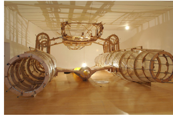
Vue de l'exposition 18201650h320 , Musée d'art contemporain de Lyon, 2007

Né en 1959 à Fort-de-France, Martinique Vit et travaille à Lyon bgrosol@gmail.com