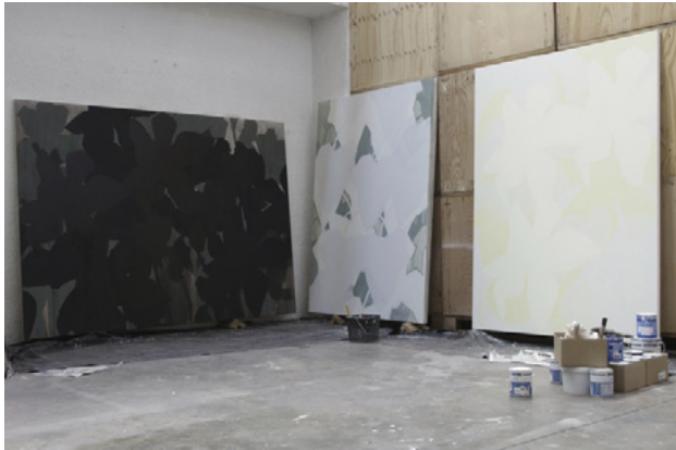
Vue d'atelier, La Mezz, Pierre-Bénite, 2014 Technique mixte sur toile

Né en 1980 à Toulon Vit et travaille à Lyon frederic.houvert@gmail.com