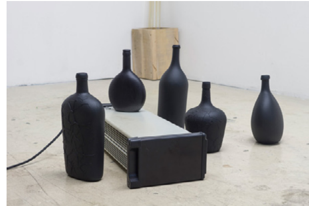
Corps d'hiver , 2017 Bouteilles en verre, peinture thermochromique, dimensions variables

Né en 1986 au Portugal Vit et travaille à Clermont-Ferrand s.brunomail@gmail.com