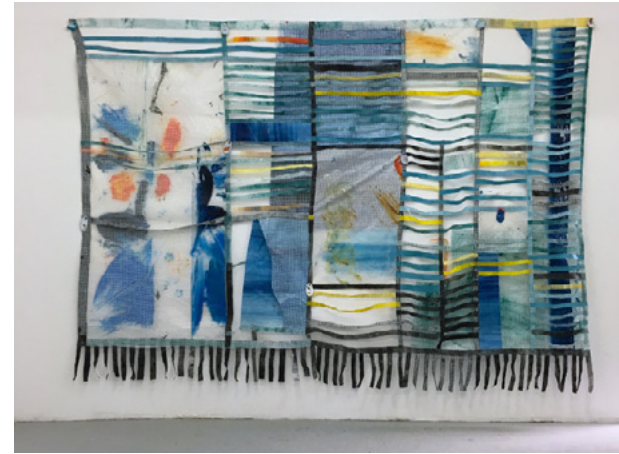
Bikini, 2019 Peinture à l'huile sur bâche tissée translucide, coquilles d'huîtres, chewing-gum, décalcomanies, 3 x 2 m

Né en 1984 à Pessac Vit et travaille à Lyon simonfeydieu@yahoo.fr