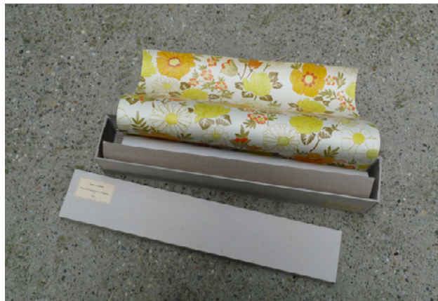
Habiter des maisons vides - Occupation , 2013 - 2014 Crayon de couleur, 0,83 x 10 m