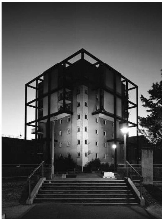
La tour, série Logements sociaux, 2011-2012 Collection Ville de Vénissieux

« A partir de 2001, je mène un travail photographique constitué de portraits, de vues d'architectures et de paysages urbains, traitant de situations, d'environnements ou de groupes d'individus. Lié à la notion de condition sociale, ce projet m'a amené à traverser les marges physiques de ma société (foyers, bidonvilles, cités...) et ses marges historiques incarnées par notre passé colonial.