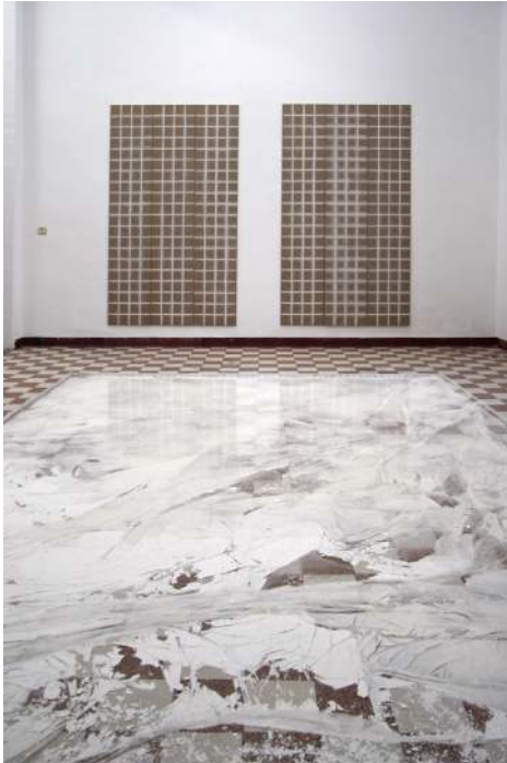
Peau pour Gouttières, 2014 Vue de l'atelier à Air Antwerpen, Anvers, 2014

Atelier : laMezz, 14 Rue de la Grande Allée, Pierre-Bénite