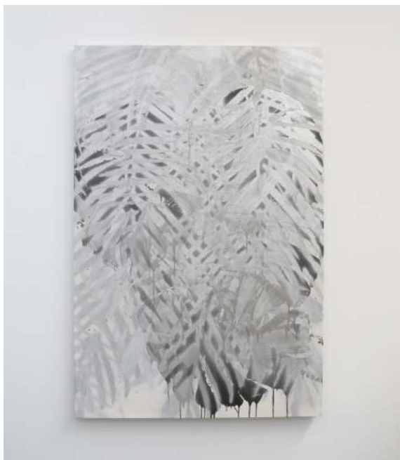
Phoenix Chrome, 2016

Atelier : laMezz, 14 Rue de la Grande Allée, Pierre-Bénite