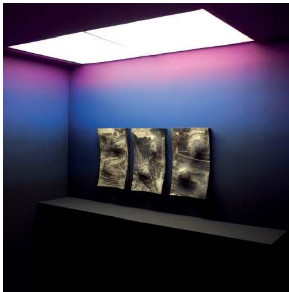
Série MMP dans une carrière n° I, II, III, 2013 Vue de l'exposition Parc d'activité, Galerie Tator, Lyon - Photo : © Emilien Adage

Atelier : 34 rue Gervais Bussière, Villeurbanne