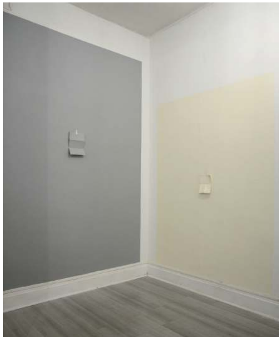
Les Pages, 2013

Exposition et travail in situ à La Mire, Lyon