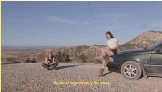
Le livre d'Élie chap.2 : Le boulevard de la mort, vidéo couleur, son stéréo, 8'35", production à la montagne, DRAC Nouvelle-Aquitaine, 2019

2022 Baxandere , l'Avant-poste, La Réole • VILLNA , La réserve, Bordeaux 2021 65e Salon de Montrouge , Montrouge • De la peinture , Espace 29, Bordeaux 2020 Lapin-Canard , Fabrique Pola, Bordeaux 2019 24h d'inauguration , Zebra3, Bordeaux • Clôture , Galerie Arondit, Paris • Tainted Love South Club Edit , Villa-Arson, Nice 2018 Cellar Door , Galerie Arondit, Paris (prod. Generator) • Romantic again , Galerie Netplus, Cesson-Cevigné • Postpop , Galerie Art&essai, Rennes (prod. Generator) 2017 Tainted Love , Le confort moderne, Poitiers • Nekuia , Remi Ruprecht et Soil collective,