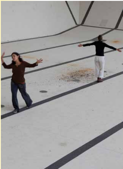
Nous ne confierons pas nos corps au repos , 2021 Extrait vidéo

Filorian Gaité, D'une plasticité nue, un corps qui désarme (extrait), juin 2022. Commande de Documents d'artistes Nouvelle-Aquitaine.