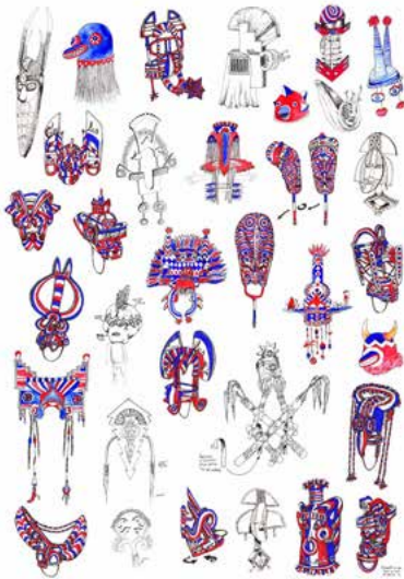
Les masques du Caylus Culture Club, 2021 Poster Lapin-canard Édition de 10 exemplaires, 84 x 110 cm

2022 Bains de forêt , L'artichaut, Bordeaux (Commissariat : Irwin Marchal - La forêt d'art contemporain) 2021 Desperanto , Fabrique Pola, Bordeaux (Commissariat : Zébra 3) 2020 Outilthèque , Chantier Public, Poitiers 2019 Il est une fois dans l'ouest , Frac Nouvelle-Aquitaine MÉCA, Bordeaux 2017 Espèce d'objet ! , CIAM La Fabrique, Toulouse • Espèce d'objet ! , Maison des arts George Pompidou, Centre d'art de Cajarc. 2016 Sécu Surface I (Arthur, ses cousines et ses tantes), dans le cadre de l'exposition du Prix Mezzanine Sud, Les Abattoirs, Toulouse.