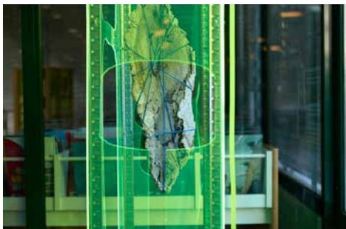
Vitrine #1, Us & Bitume , détail, 2022