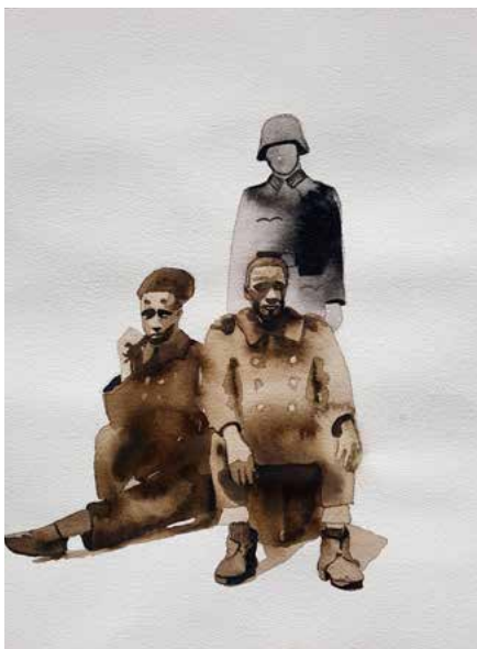
Les hosties noires , 19 juin 2020 Aquarelle sur papier 300 gr., 41 x 31 cm série 44 jours au printemps , 2020, 57 aquarelles sur papier 300 gr.

Elise Girardot, Le corps historique (extrait), novembre 2020. Commande de Documents d'artistes Nouvelle-Aquitaine