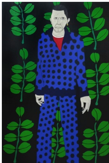
Alain 4x4 - Polyscias Custipongia, 2023