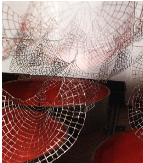
Extrait de l'Envol, 2008

Installation, Paille, agrafes, mécanismes, lumières, 40mX30mX12m, Fondation Clément