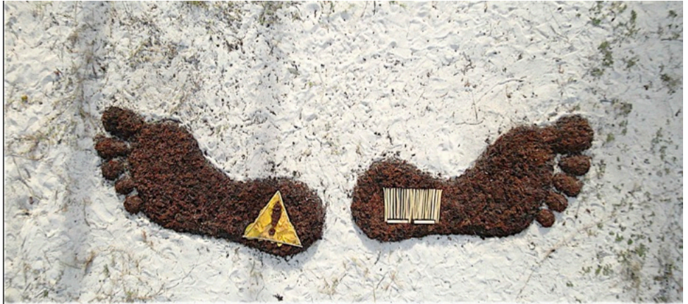
Missié Kriminel , Vidéo installation 1'20 Algues sargasses, feuilles, bois de gaulette Plage du Macabou , Le Vauclin , Martinique, 2021