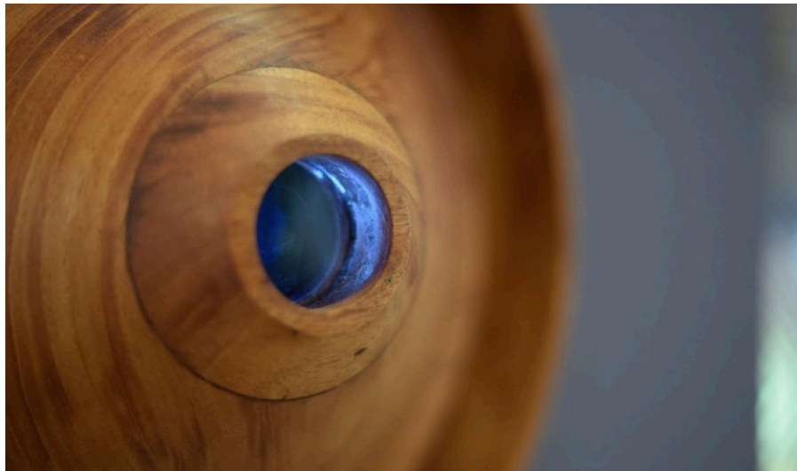
L'oeil perméable, 2020

Résidence Tremplins - Tropiques Atrium, 2020