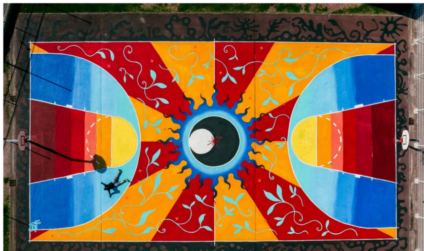
« Entre-Deux » à Bordeaux fresque de 600m2 sur le thème de l'acceptation et de la complémentarité en partenariat avec Milmurs, 2017

Depuis toujours intéressé par le monde artistique, ce n'est que depuis 6 ans que j'ai décidé de faire de ma passion mon métier. Fasciné par le monde du vivant et ses problématiques ; mes productions sont souvent parsemées par des formes organiques et poétiques faisant référence à mes sujets favoris.