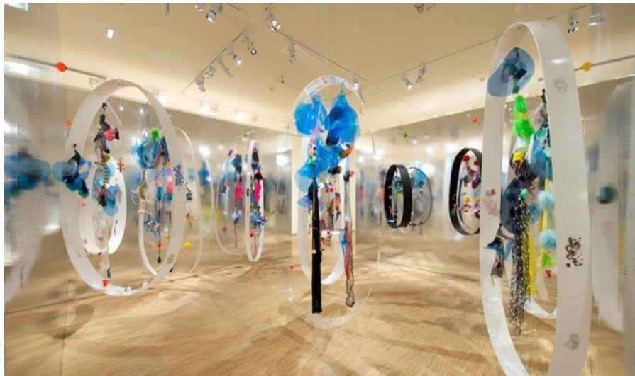
Vue d'exposition Ernest Breleur, Le vivant, passage par le féminin , Fondation Clément, 2016

Peintre prolifique et fondateur du groupe Fwomajé, Ernest Breleur explore initialement les croisements culturels entre l'Afrique, l'Amérique, l'Europe et l'Inde. Cependant, il quitte ce collectif en réalisant que son approche d'une Afrique idéalisée reste éloignée de la réalité. Il s'oriente alors vers une expression artistique contemporaine plus ouverte, marquée par des séries comme Série Noire et Mythologie de la lune . En 1992, il abandonne définitivement la peinture pour adopter un matériau innovant : la radiographie. Ce choix marque un tournant décisif dans sa carrière, lui permettant de travailler sur l'intimité du corps, explorant son intériorité et les questions métaphysiques de la vie et de la mort. Depuis plus de 28 ans, Breleur interroge sans relâche les potentialités de la radiographie, tout en intégrant des solutions plastiques et des formes nouvelles. Influencé par des penseurs comme Édouard Glissant et Patrick Chamoiseau, il inscrit son travail dans une réflexion sur l'esthétique, l'éthique et les violences de la mondialisation. Exposé dans des lieux prestigieux tels que le Queens Museum of Art ou la Maëlle Galerie, il continue de réinventer son art, portant un regard sensible et engagé sur le monde.