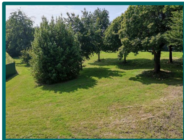
Accès direct au jardin et au Parc de la Briantais